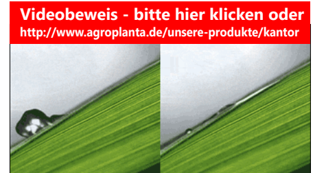
Hochgeschwindigkeits-Video Aufnahmen: max. 10.000 fps